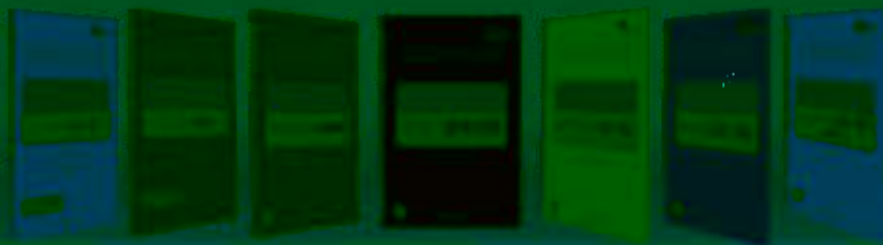
高度 广度 深度 精度 速度 温度 力度 温度